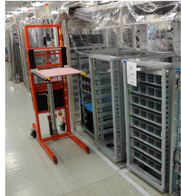
リフターの適用例